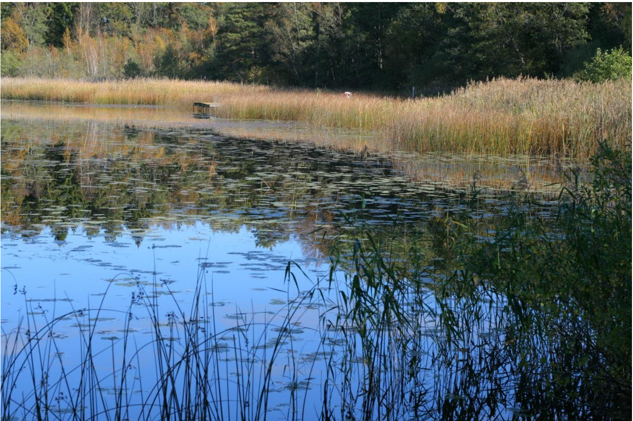
Bild: Väsjön 2015